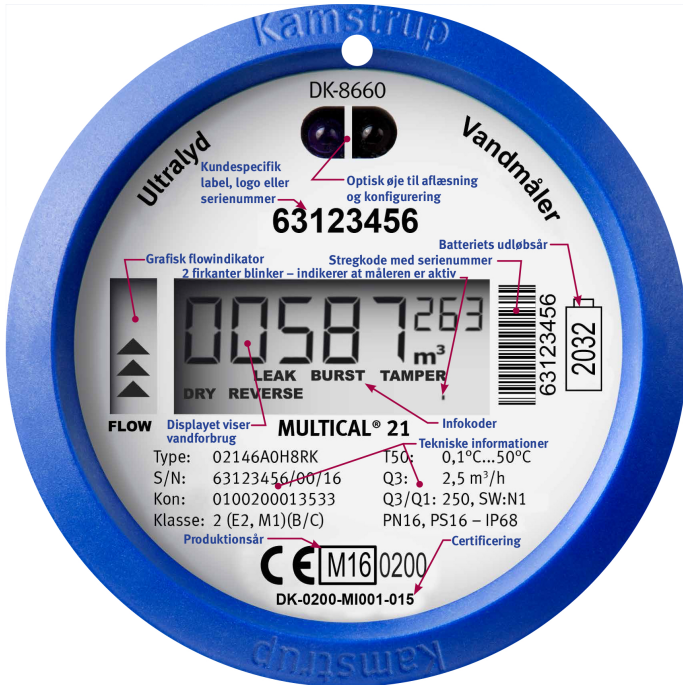
Kamstrup VAND-måler. Aflæses i m 3